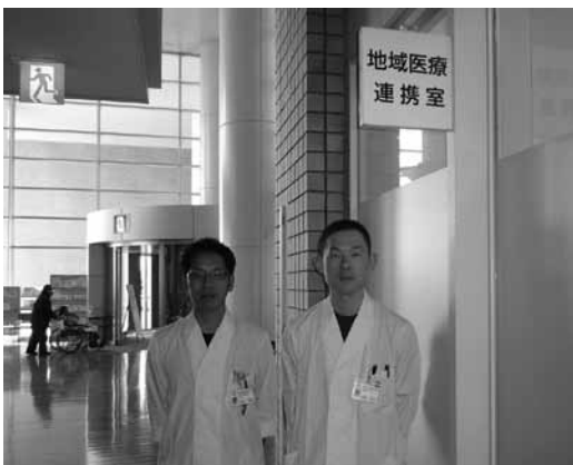
地域医療連携室のスタッフ