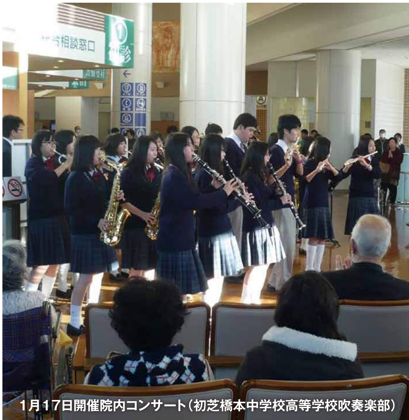
1月17日開催院内コンサート(初芝橋本中学校高等学校吹奏楽部)