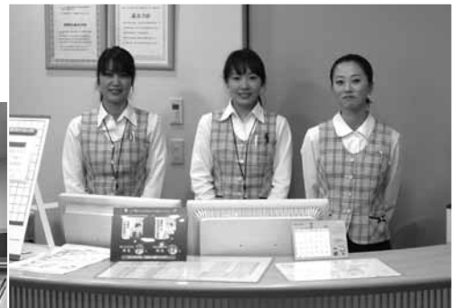
健診センターのスタッフ

定期的に健診を受けることは重要で、その結果、要精密検査や要治療などと判定された場合には、速やかに医療機関を受診することは当然なことであります。しかし、わずかな異常を指摘された場合にこそ、これを放置することなく、適切な保健指導を受け生活習慣を改善し、病気になる体づくりに努めるきっかけにしていくことが非常に大切であり、病気を予防することにつながるのです。