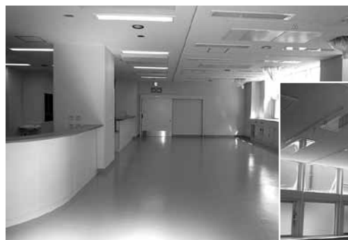
HCUの内部(医療機器搬入前)