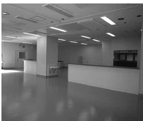
HCUスタッフステーション

一方、当院は高度医療を提供するために、HCU（ハイケアユニット）が、3月で6床完成しました。大きな手術後の患者さんや緊急入院など高度な医療を必要とする重症患者さんを24時間体制で引き受けます。当院は、高度急性期、急性期、亜急性期と患者さんの状態に応じて、医療サービスが提供できるように病床を機能分化する体制作りをしています。